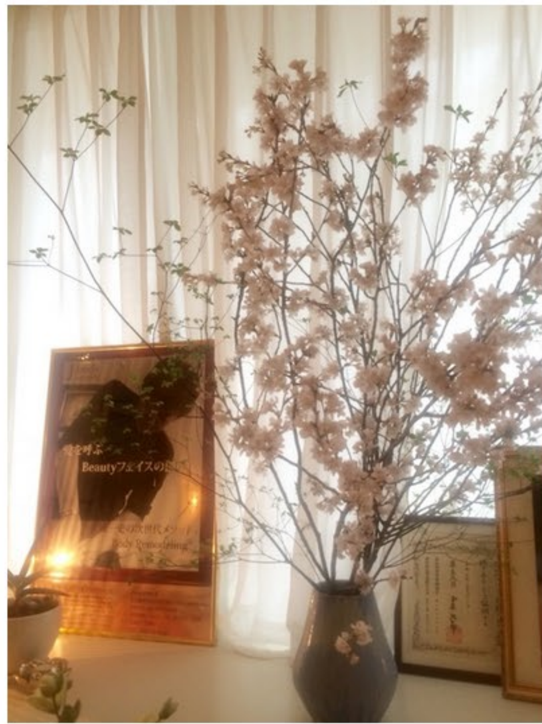
ジェームス君も健在！桜も飾られて

昨日は腕の痛さにかまけなくて駆け込み寺であるJ-body(PCサイト)へ！！ 右肩がバンバンで盛り上がるほどでした。 右腕が巻き込みやすいらしく、腱鞘炎の痛みが酷くて、ゴッドハンドの手に委ねました。